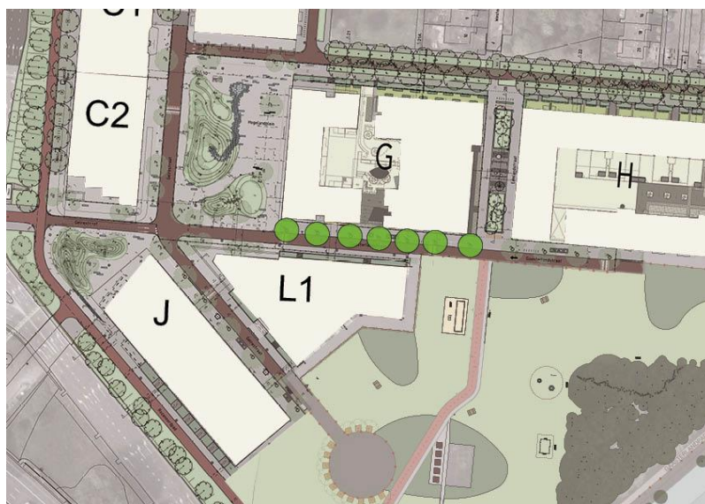
Afbeelding 2 Locatie bomen Gaasterlandstraat

Thijs Koolmees Projectmanager Kop Zuidas