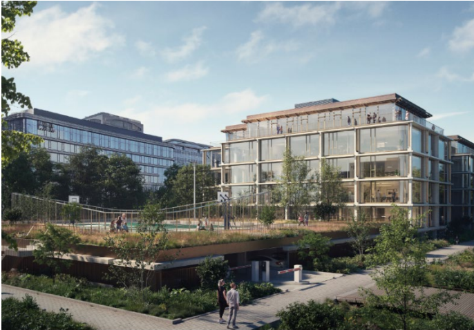
Sfeerbeeld van een mogelijke nieuwe inrichting