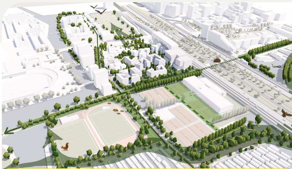
Belangrijke groene verbinders en een sterke ecologische structuur.

Met vergroenen in Verdi wordt bedoeld: bestaand groen verbeteren, nieuw duurzaam groen (met een lange levensduur) toevoegen en het creëren van goede verbindingen/aansluitingen tussen de verschillende typen groen. Het verbeterde en nieuwe groen