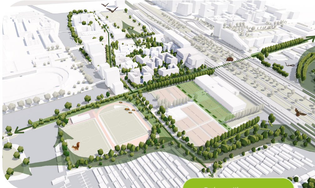
Belangrijke groene verbinders en een sterke ecologische structuur.

Omdat in Verdi relatief veel vierkante meters groen zijn en er beperkt ruimte is meer groen toe te voegen, wordt vooral ingezet op het verbeteren van de kwaliteit van het groen. Vergroenen staat vooral voor het ver-