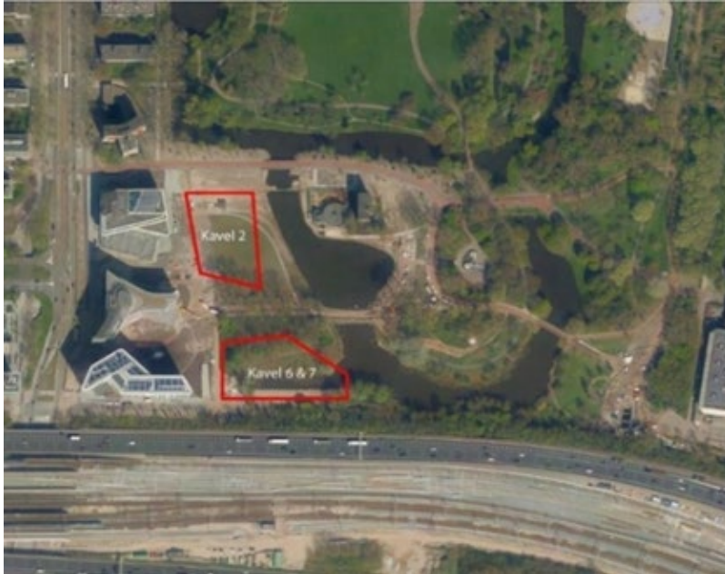
Kavel 6/7 en kavel 2 aan het Beatrixpark

De voorbereidingen voor de bouw starten in mei/juni dit voorjaar. Naar verwachting start de bouw van de woningen rond de zomer 2023 en duurt tot en met half 2026. De route van het bouwverkeer loopt vanaf de A10 S109, Europaboulevard, De Boelelaan, Beethovenstraat en Christiaan Neefestraat