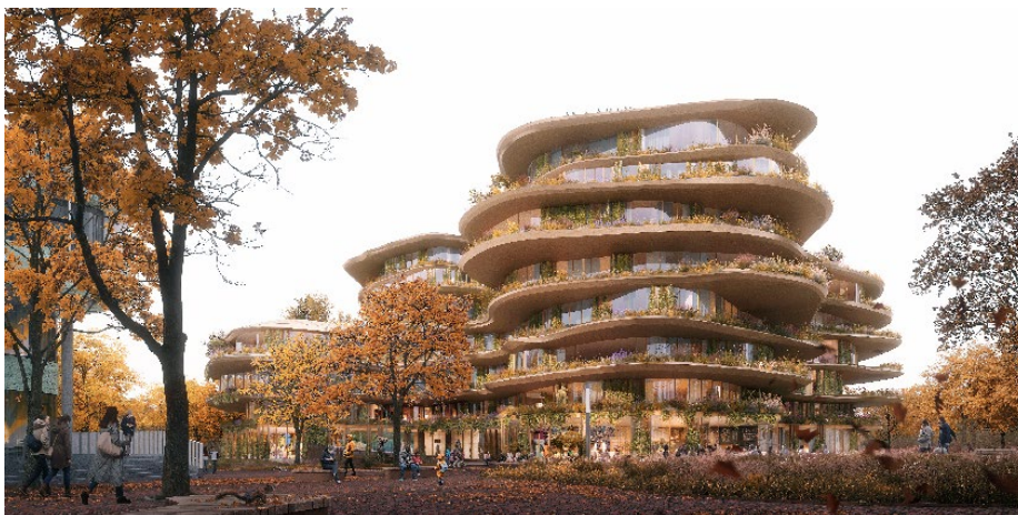
Impressie Habitat Royale

Ontwikkelaar Kondor-Wessels Vastgoed heeft met het ontwerp 'Habitat Royale' van architectenbureau Mecanoo de tender voor kavel 2 aan het Beatrixpark gewonnen. De wijze waarop het gebouw is ingepast in het landschap en de maximale score op gebied van duurzaamheid heeft ervoor gezorgd dat dit plan als winnaar uit de bus kwam.