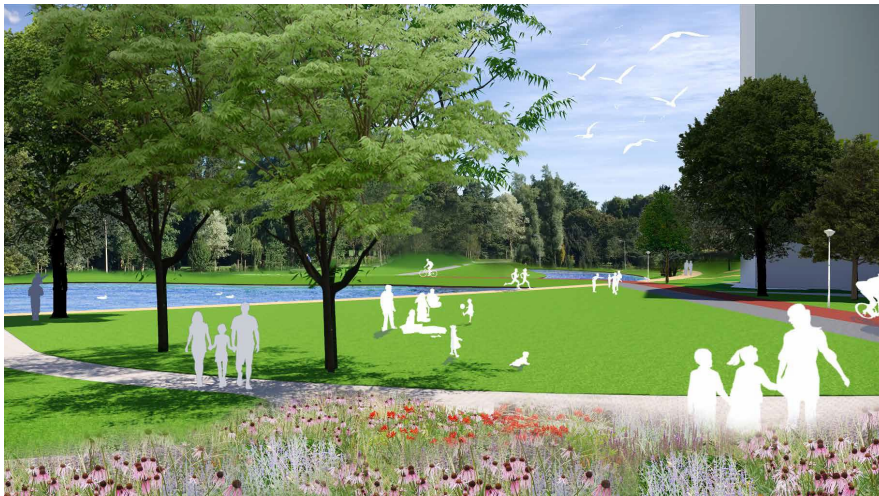
Impressie openbare ruimte