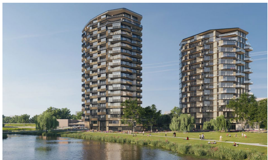
Impressie kavel 6/7

De verwachting is dat het gebouw medio 2026 gereed is, en dat de eerste bewoners er vanaf dat moment hun intrek in kunnen nemen.