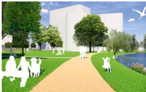
Impressie voetpad langs oever