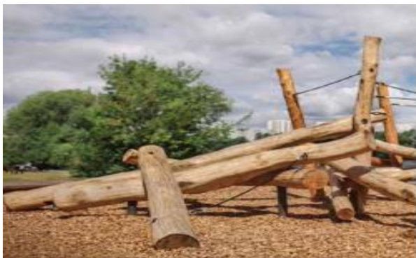
Voorbeeld houten speelobject