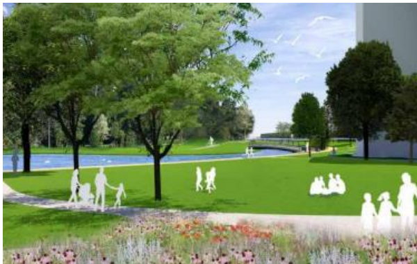
Impressie 'open kom'