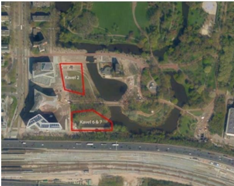
Kavel 2 (Habitat Royale) en kavel 6/7 (Park Meadows) aan het Beatrixpark

In het Zuidas-deelgebied Beethoven, gelegen tussen de Beethovenstraat, Prinses Irenestraat, het Beatrixpark en de A10, wordt momenteel volop gewerkt aan de bouw van het complex Park Meadows op kavel 6/7 (zie kaartje). Verder wordt het voormalige Convict gereed gemaakt voor de opvang van Oekraïense vluchtelingen en wordt achter de schermen de laatste hand gelegd aan het ontwerp van Habitat Royale, het geplande woongebouw op kavel 2. Met deze nieuwsbrief informeren wij u over de laatste ontwikkelingen en presenteren wij het voorlopig ontwerp van de openbare ruimte voor dit gebied.