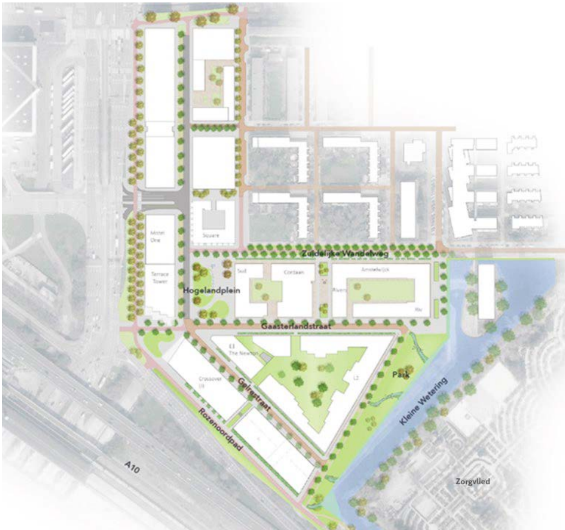
Kaartje Kop Zuidas