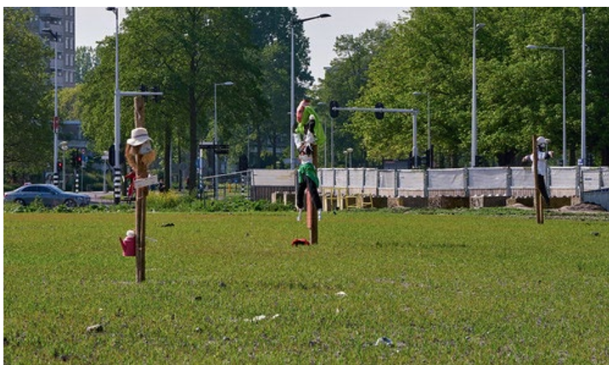
Vogelverschrikkers op de leegstaande kavels C en D.

En wellicht heeft u ze al gezien, maar sinds kort staan er meerdere vogelverschrikkers op het stukje grond, omdat er 5000 m 2 haver is ingezaaid om de braakliggende kavels wat kleur te geven.