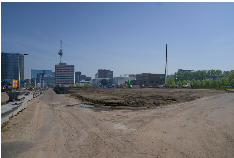
Ravel gezien vanaf de Beethovenstraat, met helemaal rechts de huidige Kindercampus Zuidas