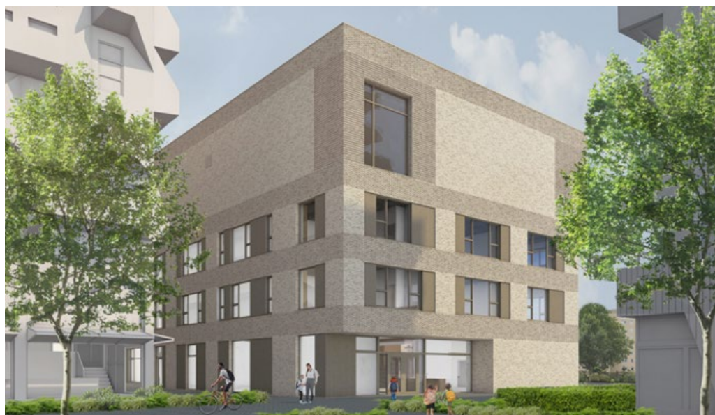
Impressie van de nieuwe Kindercampus Zuidas

In 2025 verhuist de basisschool Kindercampus Zuidas zo'n honderd meter westwaarts naar de plek waar tot voor kort de oude natuurspeeltuin was. Het nieuwe gebouw bestaat uit zandkleurige bakstenen en houten gevelelementen en kozijnen.