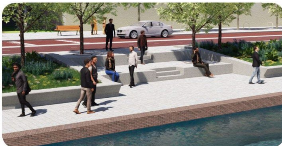
Impresie van de Maurice Ravellaan

De weg begint bij de kruising met de Beethovenstraat in het verlengde van de Gustav Mahlerlaan, en loopt in oostelijke richting door tot de Antonio Vivaldistraat. Daarmee wordt het de belangrijkste toegangsweg voor voetbalclub AFC aan de noordkant van de laan en van Ravel aan de zuidkant.