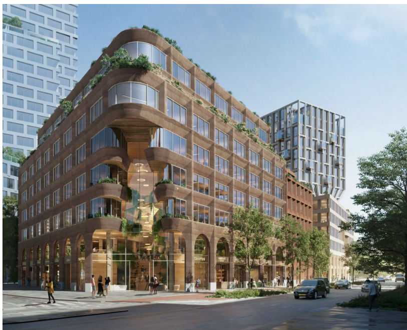
Artist impression "The Canyon", het noordelijk gelegen gebouw van project The Harmony gezien vanaf hoek Beethovenstraat – Maurice Ravellaan.

De begane grond, met de ene zijde aan de Beethovenstraat en de andere gericht op de nieuwe woonbuurt Ravel, is bedoeld voor buurtgerichte voorzieningen als een supermarkt, winkels en horeca. Halverwege 2026 wordt er gestart met de bouw.