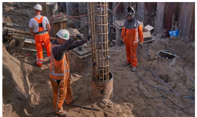
▶ 30 mei - 1 juni Nachtelijke werkzaamheden inhijzen wapeningskorven.