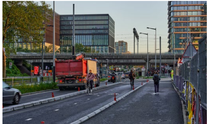
▶ Vanaf 29 april Alle voetgangers/fietsers maken gebruik van het voet/fietspad aan de westkant.