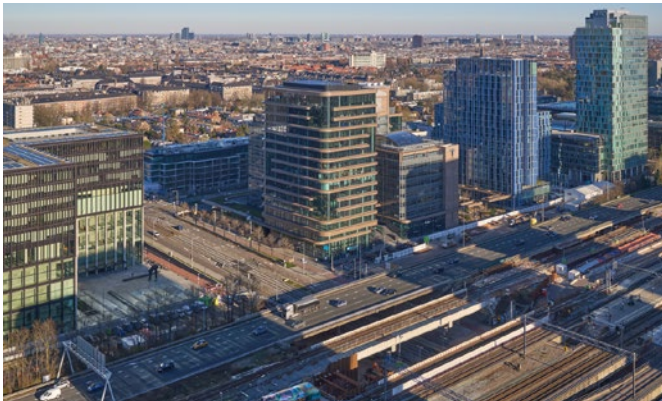
▶ 3 - 5 april Nachtelijke werkzaamheden voor verleggen Parnassusweg.